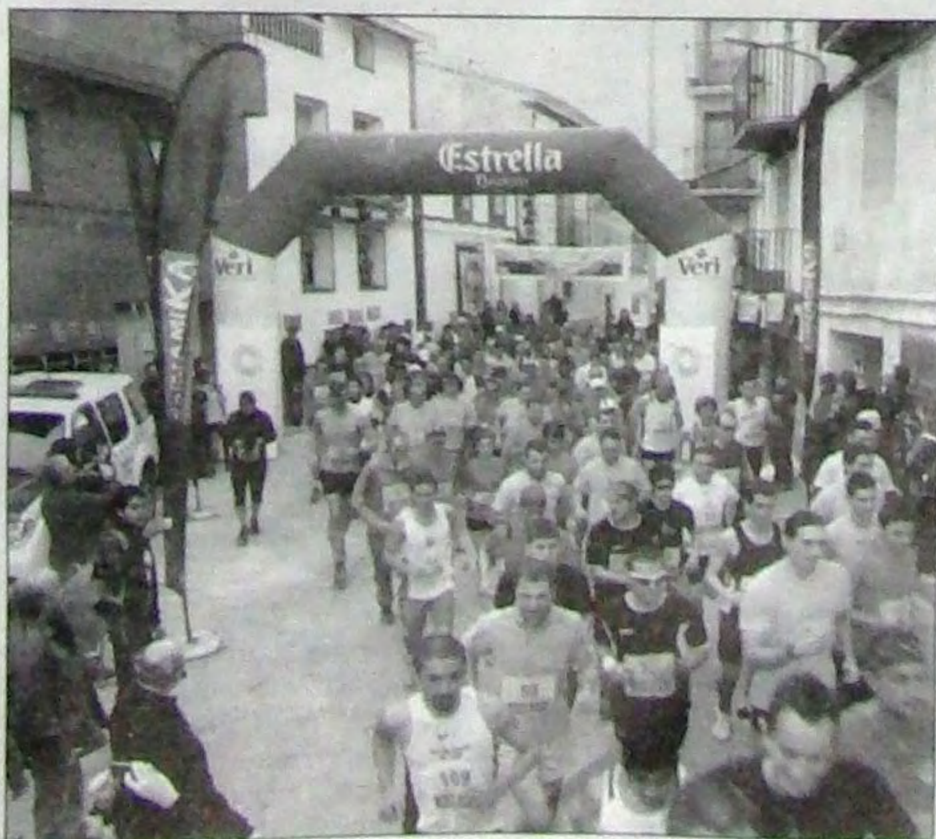
Salida de la carrera en la plaza San Agustín de Alcaine