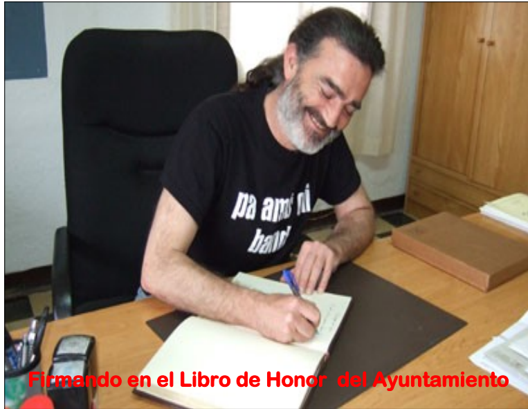
Firmando en el Libro de Honor del Ayuntamiento

En 2004 realizó dos exposiciones, una en el Ayuntamiento de Deia y otra en el Bar Sa Fonda de la misma localidad. De ahí pasó a Ecuador, donde pintó sus primeros cuadros al óleo, quedándose allí cuatro obras. Impulsado por amigos y artistas, decide dedicarse a la pintura de manera profesional en 2008